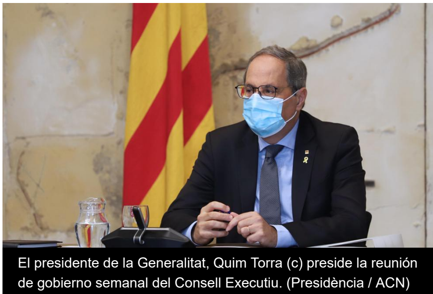
El presidente de la Generalitat, Quim Torra (c) preside la reunión de gobierno semanal del Consell Executiu. (Presidència / ACN)

Miquel Sàmper sustituye a Miquel Buch en Interior; Ramon Tremosa a la consellera de Empresa, Àngels Chacón, y Àngels Ponsa a la de Cultura, Mariàngela Vilallonga