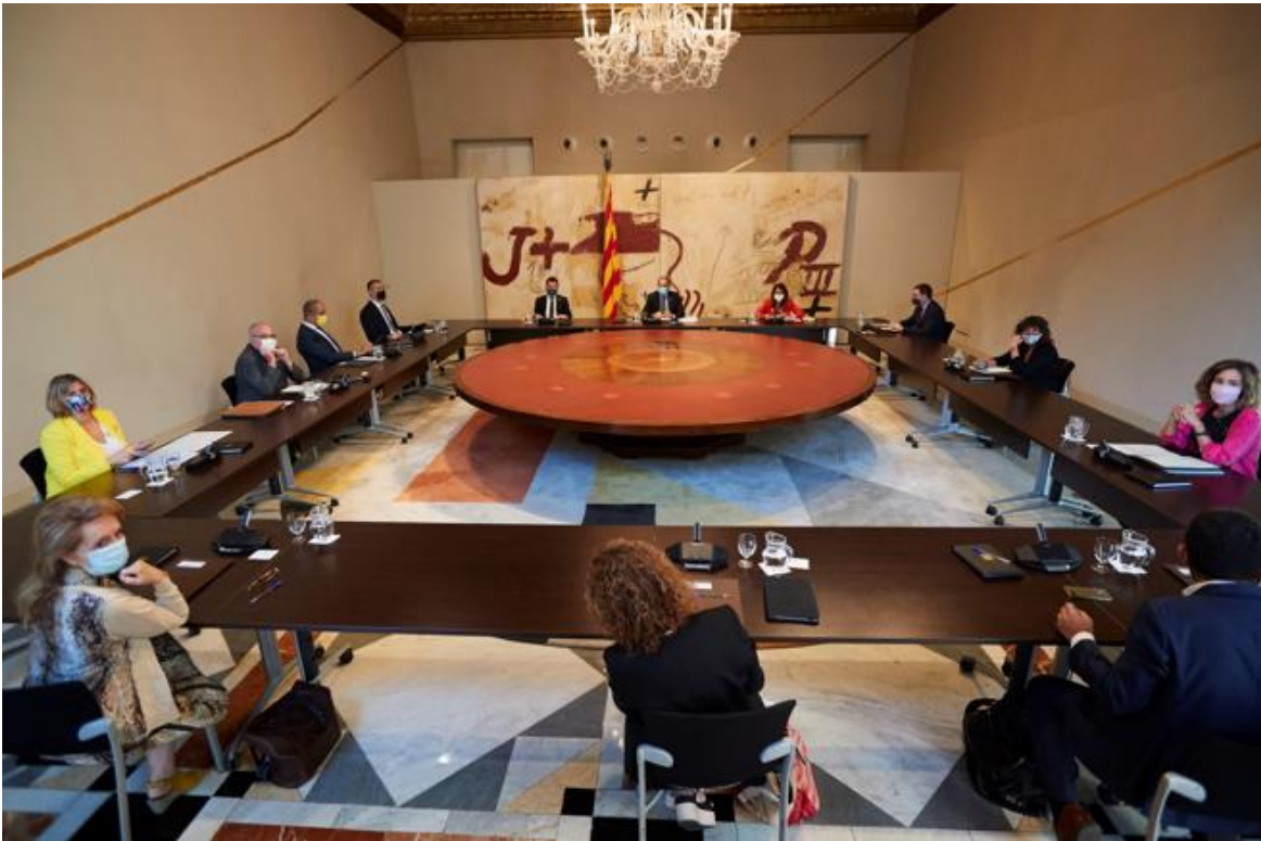
El presidente de la Generalitat, Quim Torra (c) preside la reuni3n de gobierno semanal del Consell Executiu.

Pese a la escisi3n y el gotero de bajas de asociados del PDECat, en el Govern aseguraron este mismo martes que esta situaci3n no afectaba al funcionamiento del Ejecutivo ni por tanto pod3a considerarse un motivo para adelantar elecciones. La consellera de Presidència y portavoz, Meitxell Bud3, una de las que rompieron en carnet del PDECat, coment3 en rueda de prensa que el acuerdo de gobierno entre los dos grupos parlamentarios (JxCat y ERC) estaba vigente y que la ruptura en el seno del PDECat no afectaba a esos grupos, sino que era una “cuesti3n de partidos”.